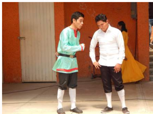
Escena de la Obra: “Mancebo que casó con mujer brava”