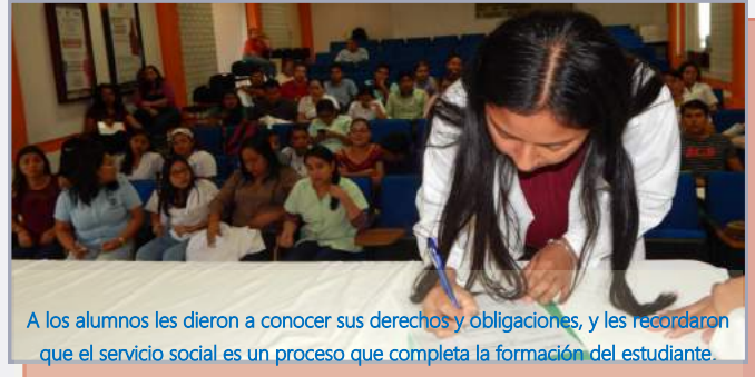
A los alumnos les dieron a conocer sus derechos y obligaciones, y les recordaron que el servicio social es un proceso que completa la formación del estudiante.

La Universidad Popular de la Chontalpa fungió como sede de la entrega de 35 campos clínicos para la prestación del servicio social a estudiantes de Psicología y Químico Farmacéutico Biólogo, y 5 para alumnas de la Lic. en Enfermería de la Universidad Mundo Maya, campus Cárdenas, evento que fue coordinado por personal de la Secretaría de Salud Tabasco.