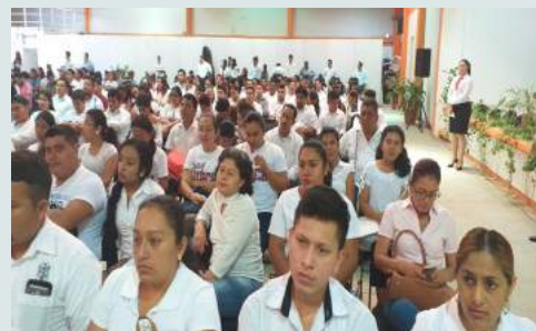
Estudiantes de la Lic. En Derecho atentos a la conferencia.