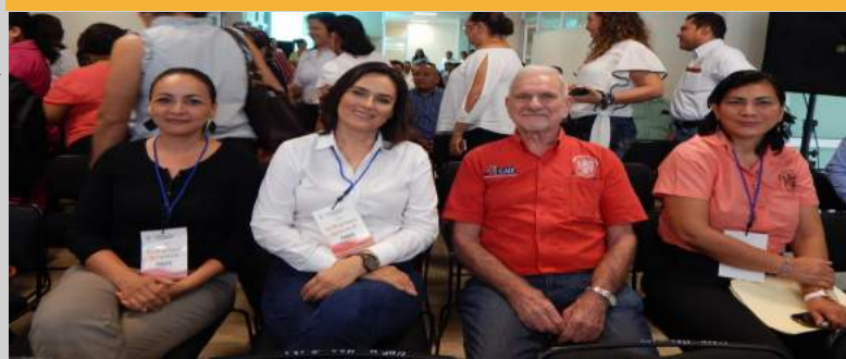
FORO “LA UPCH, LOGROS Y PERSPECTIVAS DE LA EDUCACIÓN SUPERIOR RUMBO AL 2030